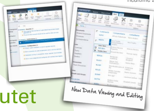
New Data Viewing and Editing